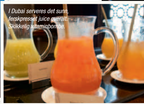
I Dubai serveres det sunn, ferskpresset juice overalt. Skikkelig vitaminbombe.